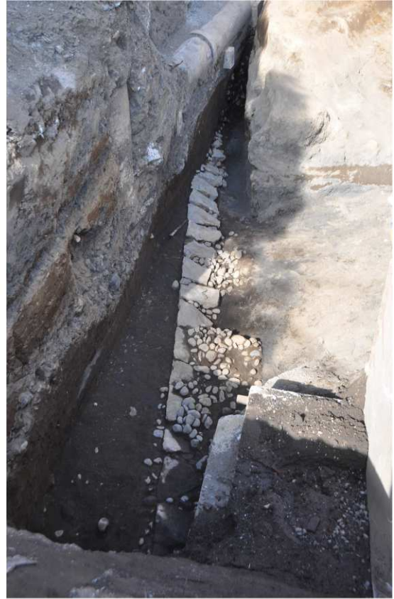
写真1 石垣検出状況（南から）