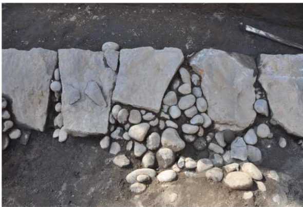
写真2 石垣検出状況（東から）