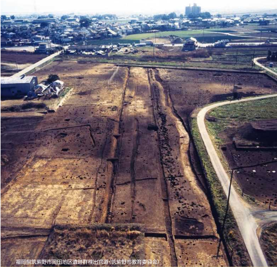
福岡県筑紫野市岡田地区遺跡群検出官道 (筑紫野市教育委員会)

熊本大学黒髪キャンパスでは、古代の国府と大宰府を結ぶ官道と思われる道が発見されています。九州各地に廻らされた通信・交通網の実態について、構内遺跡を出発点として考えてみます。