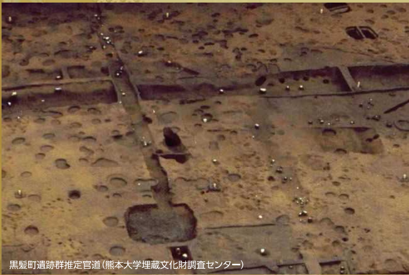
黒髪町遺跡群推定官道 (熊本大学埋蔵文化財調査センター)