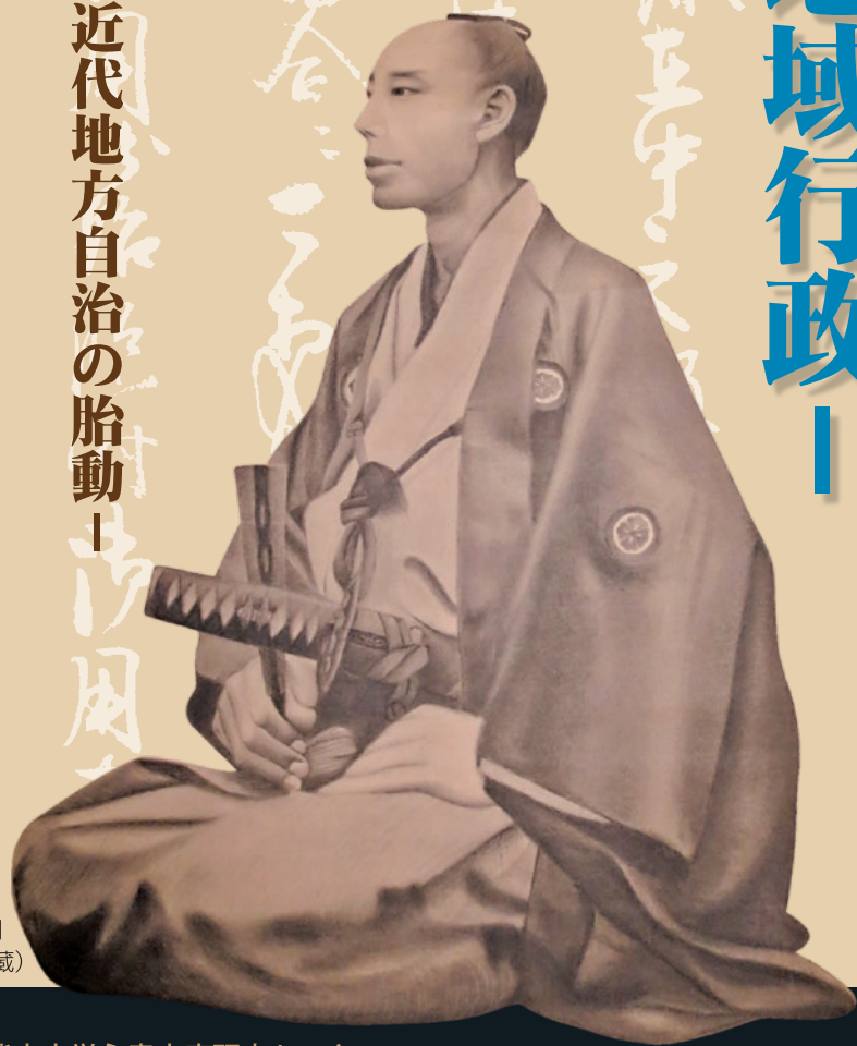
古閑忠右衛門 肖像画(個人蔵)