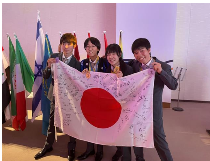
IB02023 アラブ首長国連邦大会に出場した日本代表（2023年7月）

なお、いくつかの大学では、日本生物学オリンピックでの成績が入学試験で考慮されることがあります。 ( http://www.jbo-info.jp/admission )