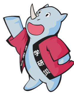
学研災キャラクター サイチャン